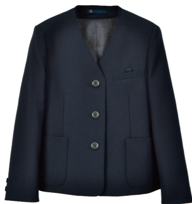
イートンシングル